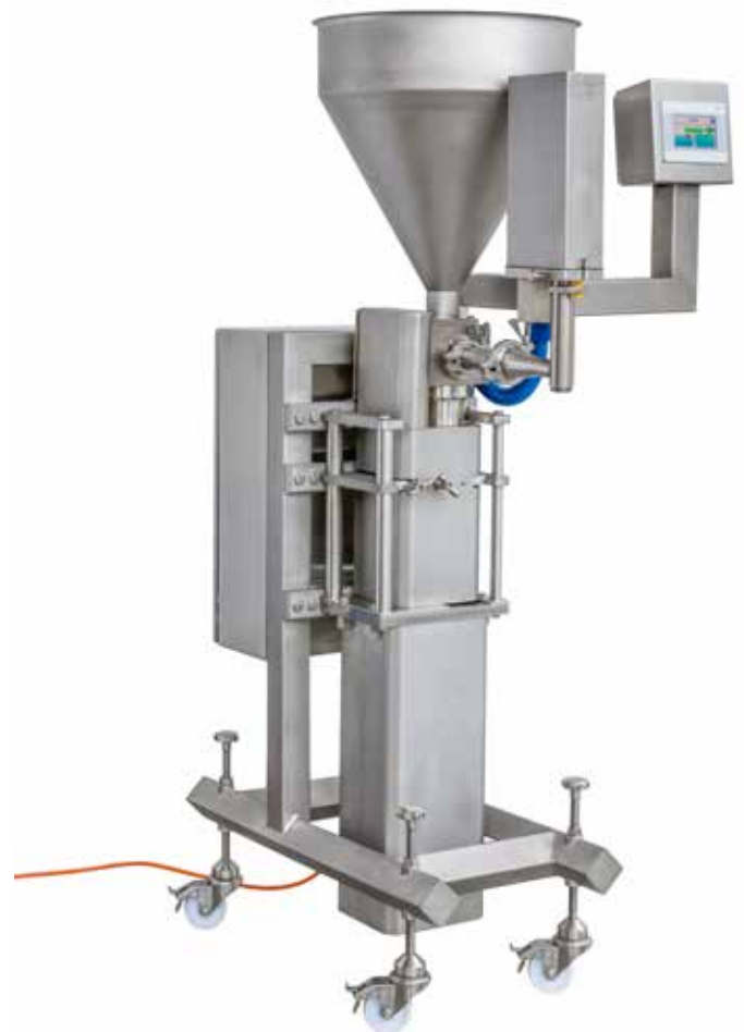
Verticale opstelling EDS